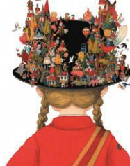
「IMAGINARIUM」 (2022) ©junaida

「Michi」「の」『怪物園』(すべて福音館書店)など、近年出版した絵本がいずれも話題の画家、junaida(ジュナイダ)。本展はたゆまぬ冒険を続けるjunaida初の大規模個展です。400点超の作品により、空想世界の全貌をお楽しみください。