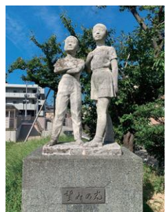
作者不詳《望みの光》 新潟市中央区・湊みどり広場内(湊小学校跡地)

長らく街の片隅にあって、多くの人に見つめられてきた、無名の人々による造形作品の数々を紹介しします。小中学校などのセメント彫刻・銭湯の壁画・新潟地震を描いた児童画など。当館だけで開催される自主企画展です。