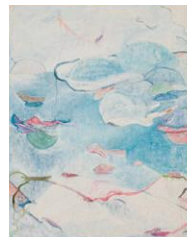
田畑あきら子(作品) 1967-68年 国立国際美術館蔵

新潟県西蒲原郡巻町(現・新潟市西蒲区)出身の田畑あきら子(1940-1969)。本展では代表作とされる一連の油彩画とともに、200点を超える素描を展示し、田畑が描きとめた儚いイメージの世界を探索します。