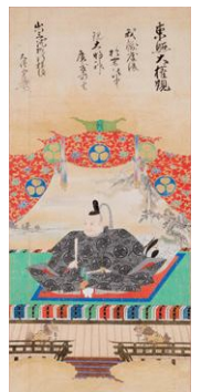
《東照大権現像》 江戸時代初期 (17-18世紀) 久能山東照宮博物館蔵

静岡に位置する国宝・久能山東照宮は徳川家康を神として祀る神社です。本展では、ここに伝来している家康所用の甲冑をはじめ日常生活で使用した品々、歴代将軍が奉納した武器や書画を紹介します。特に、歴代15代将軍全ての甲冑の展示は見どころです。