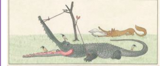
《オカミとササギ|きつねがひろつてイッパのものがたり|1》1987年 ©空想工房 画像提供:津和野町立安野光雅美術館

画家・安野光雅(1926-2020)が描いた独自の世界観をもつ絵本作品は、国際アンデルセン賞画家賞を受賞するなど国内外で高く評価されました。本展では、画家として独立する前の教員時代に着目し、多彩なジャンルの作品を学校の授業科目に見立てて紹介します。