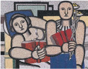
フェルナンレジェ《読書》 1984年(原画は1924年)新潟市美術館蔵

開館40周年を迎えた新潟市美術館のさまざまな場所を使い、美術館にあるものを1,000点目標に展示します。お馴染みの作品から、滅多に展示機会がないものまで、自由に多様なテーマから当館コレクションをご覧ください。