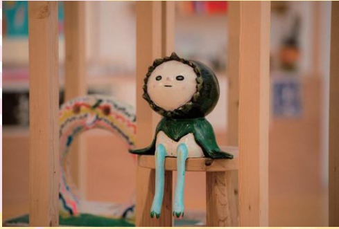
荒井良二《マッテルモン(マケット)》2014年 大分ウォーターフロント研究会蔵 ©Arai Ryoji

頬を染め、やわらかな表情で前を見つめるこの子の名前は「マッテルモン」。植物のつぼみをモチーフにしています。マッテルモンは、何を見つめ、何を待っているのでしょうか？会場で、そのヒントを探してみてください。