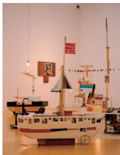
荒井良二 《new born 旅する名前のない家たちを ぼくたちは古いバケツを持って追いかけ 湧く水を汲み出す》より 2023年

まるで旅をするような気分で、活動の幅を広げてきた絵本作家、荒井良二(1956-)。本展は、作家自身による会場構成のもと、絵画や絵本原画、新作の立体作品などを紹介。荒井の作品世界に入り込むような、楽しい展示空間をご体感ください。