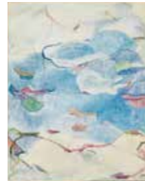
田畑あきら子の作品(油)1967-68年 国立国際美術館

Tahata Akirako was born in Maki-machi (current Nishikan-ku, Niigata). With fewer than ten of these works in existence, her paintings are characterized by layers of white paint over organic forms creating a unique floating effect. This exhibition not only features her representative oil paintings but also showcases over 200 sketches. These works offer a glimpse into the imagery that Tahata captured, highlighting her exceptional ability to convey fleeting moments through her art.