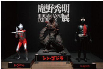
東京展[国立新美術館]会場写真

一般／1,700円(1,500円) 大学・高校生／1,300円(1,100円) 中学生以下無料 前売券[一般のみ]／1,500円 ※( )内は有料20名様以上の団体料金