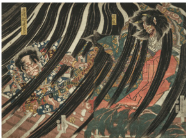
歌川国貞(英鬼 辰橋綱達変化) 文化12(1815)年頃 Bequest of Maxim Karolik

一般／1,600円(1,400円) 大学・高校生／1,300円(1,100円) 中学生以下無料 前売券[一般のみ]／1,400円 ※( )内は有料20名様以上の団体料金