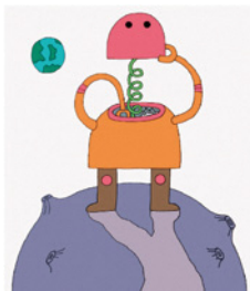
「しまぐれロボット」(文・星新一)表紙 1999年 理論社 ©Wada Makoto

一般／1,400円(1,200円) 大学・高校生／1,100円(900円) 中学生以下無料 前売券[一般のみ]／1,100円 ※( )内は有料20名様以上の団体料金